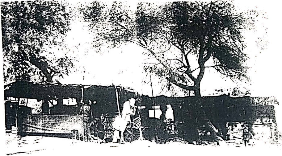
मकरोनिया क्षेत्र में संचालित अवैध दुकानों का एक ताजा चित्र